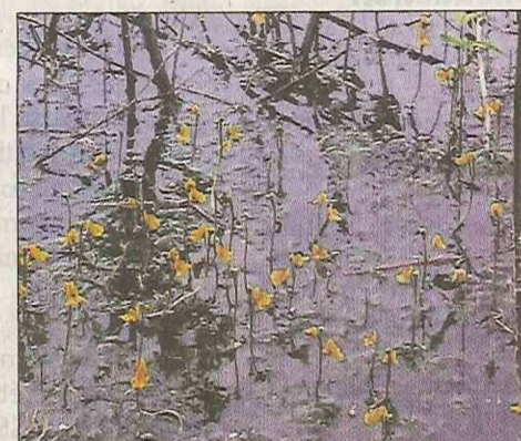
À Friesen, la restauration d'un étang par ses propriétaires a permis le retour d'une autre plante aquatique : l'utriculaire négligée.