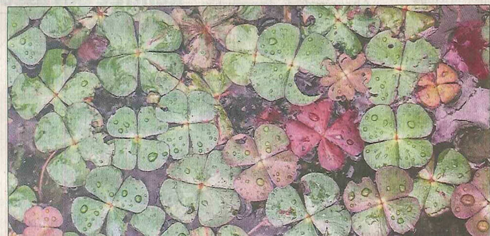
La marsilée à quatre feuilles : une espèce végétale qui fait son retour au bord des étangs.

Le programme européen Natura 2000 concerne plus de 1750 sites à travers la France, référencés pour la faune et la flore exceptionnelles qu'ils contiennent. Pour chaque site identifié, un document d'objectifs (Docob) est élaboré par un comité de pilotage (Copil), représentatif de la vie locale : élus, administrations ou autres associations. Un document qui définit les règles de gestion permettant la conservation des habitats, de la faune et de la flore du site en déterminant et en finançant les différentes actions à engager. Dans le Sundgau, le programme du site « vallée de la Largue » avait été initié il y a quatre ans et concerne plus d'une trentaine de communes, soit un millier d'hectares.