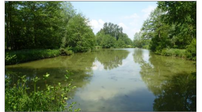
Cet étang de pêche de Seppois-le-Haut va être vidé et transformé en zone inondable. Un chantier inédit pour la prévention des crues.